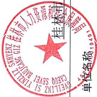
桂林市人力资源和社会保障局 2022 年度行政检查实施情况统计表