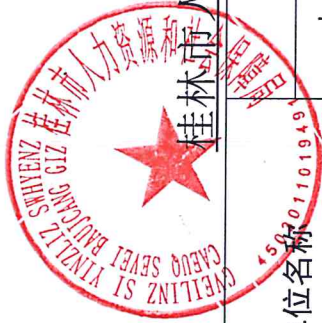
桂林市人社局 2022 年度行政许可实施情况统计表