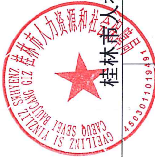
桂林市人社局 2022 年度行政征收实施情况统计表