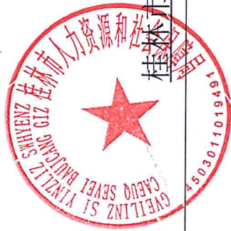
桂林市人社局 2022 年度行政征用实施情况统计表